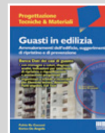
Guasti in edilizia