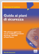
Guida ai piani di sicurezza