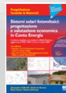
Sistemi solari fotovoltaici