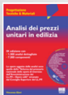
Analisi dei prezzi unitari in edilizia