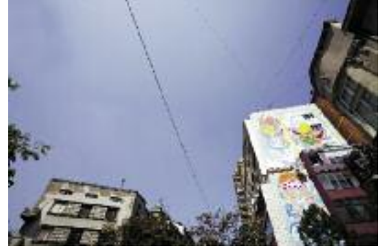
Biljana Djurdjevic, "Mural"