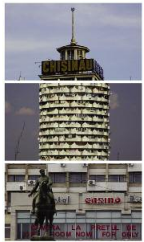
Pavel Braila, "Untitled"