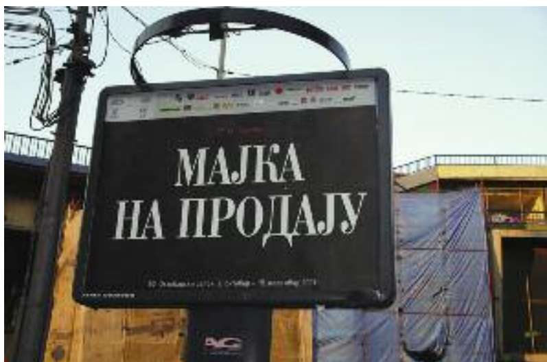
Rasa Todosijevic, "Majka na prodaju"